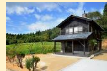
空き家あんしんサポート