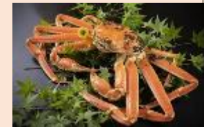
地元特産品の斡旋協力