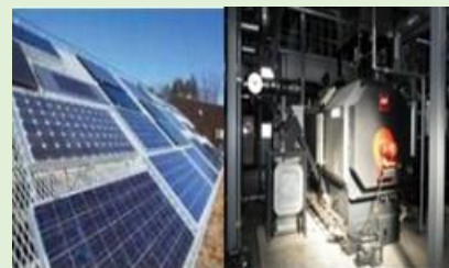
省エネルギーの促進