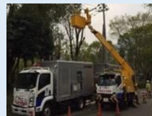
災害時の停電復旧作業