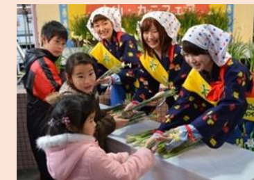
地域イベント等への協力