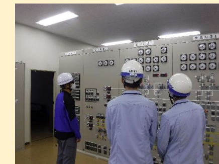
担い手づくりへの協力 (インターンシップ受け入れ)