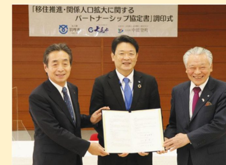
七尾市・羽咋市・中能登町 パートナーシップ協定への協力