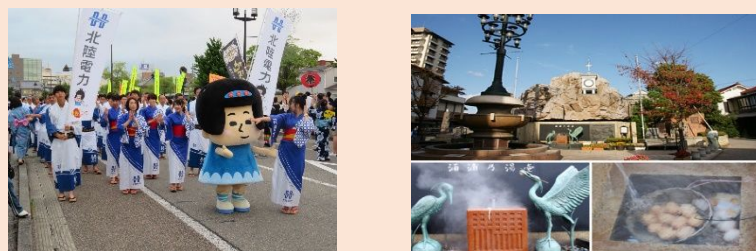
みなと祭りへの参加