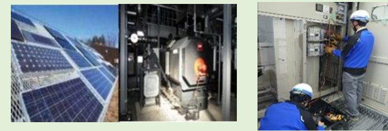
再生可能エネルギー等の促進