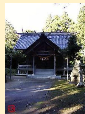
地域資源の保全協力(総社本殿)