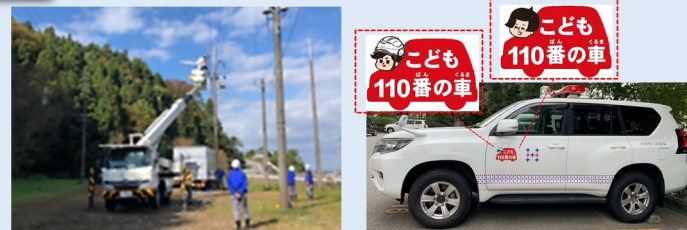
災害時の停電復旧作業