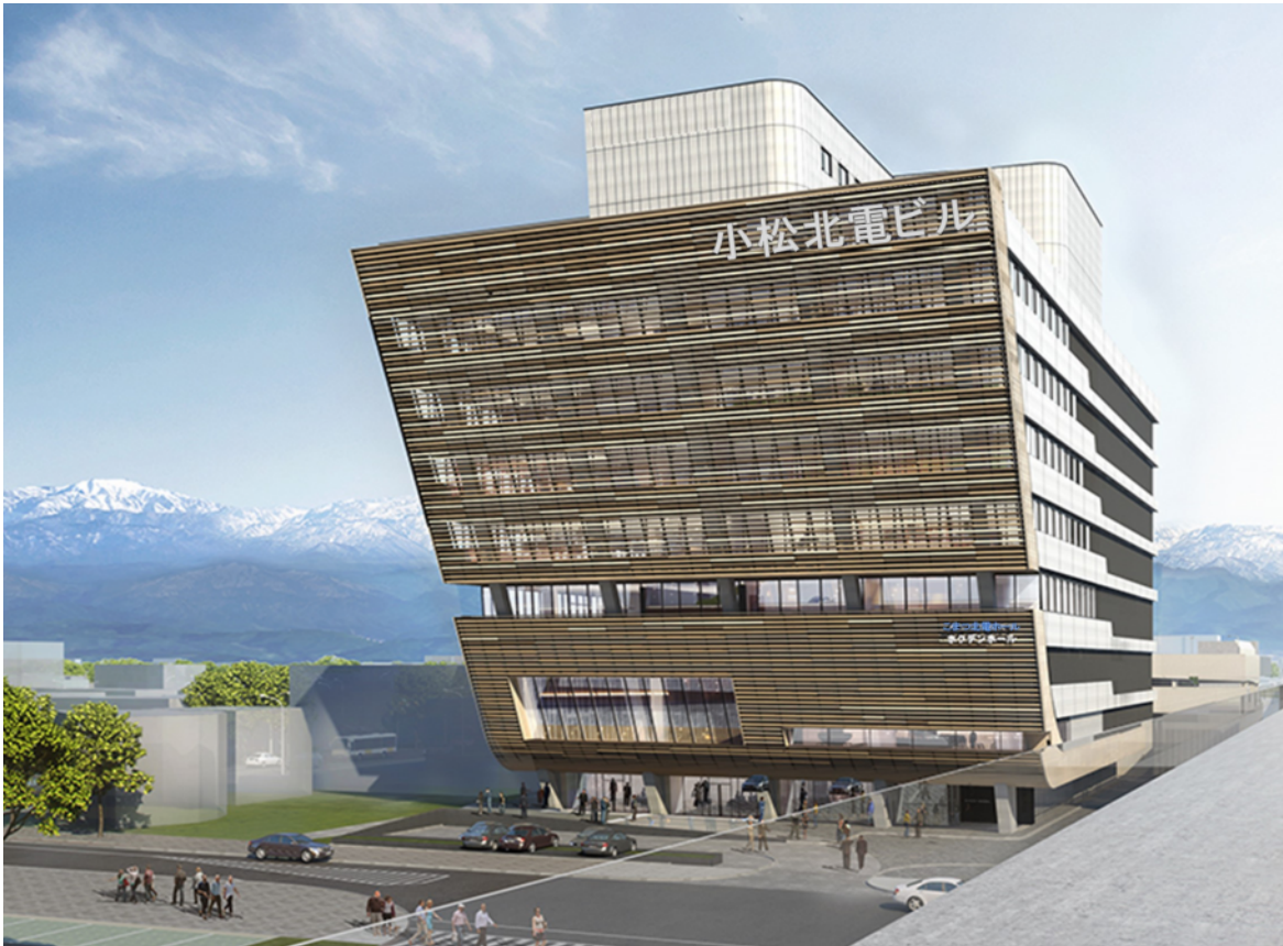
小松駅東地区複合ビル外観